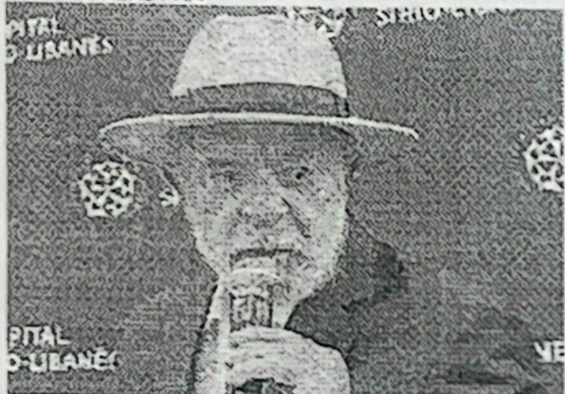
PRESIDENTE Lula: pesquisa mostra dificuldade